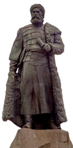
Ерофей Хабаров