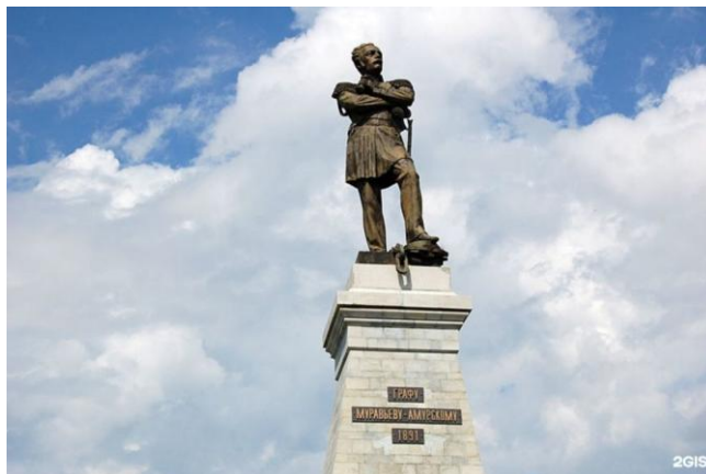
Памятник генерал-губернатору Восточной Сибири Н.Н. Муравьеву-Амурскому в Хабаровске

Самые первые памятники на Дальнем Востоке появились в девятнадцатом веке. Два из них были установлены в Хабаровске и Владивостоке в честь генерал-губернатора Восточной Сибири Николая Муравьева-Амурского и адмирала Геннадия Невельского.