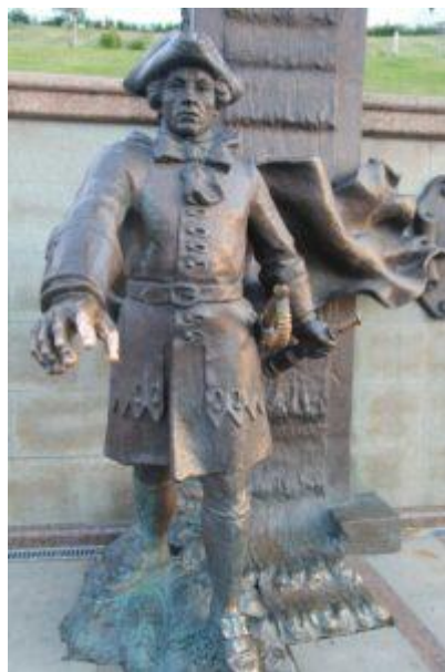
Витус Беринг

Берингово море, Берингов пролив, остров Беринга – названия этих точек на карте России нам известны со школьных лет. Открыты и исследованы они были в первой половине восемнадцатого века, то есть около трехсот лет назад, двумя Камчатскими экспедициями под командованием Витуса Беринга. Этот датчанин верой и правдой служил России, благодаря ему Камчатка и Командорские острова стали частью Российской империи. На Командорских островах он и упокоился.