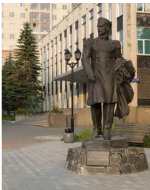
Памятник адмиралу Г.И. Невельскому в Южно-Сахалинске.

Для сведения: Николай Николаевич Муравьев-Амурский был генерал-губернатором Восточной Сибири с 1847 до 1861 года. Именно по его инициативе был заключен Айгунский договор о возвращении левобережья Амура России. Он также считается основателем Амурского казачьего войска городов Благовещенска, Владивостока и Хабаровска.